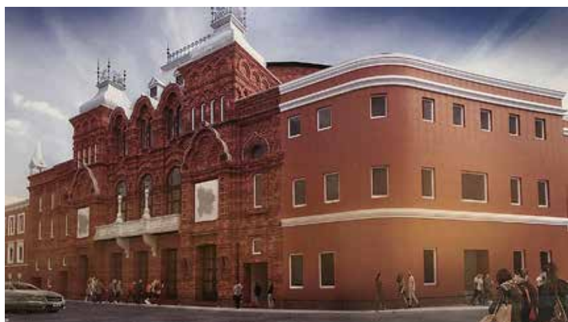
На фото: дореволюционный вид здания Театра и проект его реконструкции

М есто, где сейчас находится наш Театр, всегда было “театральным”. Когда в пожаре 1812 года сгорает “круглая зала”, принадлежавшая купцу Зарубину и использовавшаяся для проведения маскарадов и концертов, княгиня Шаховская-Глебова-Стрешнева, владевшая домом по соседству — сейчас “Геликон-опера” — и обожавшая свой домашний театр, с подачи предприимчивого антрепренера Георга Парадиза выкупает пепелище и к концу 1886 года возводит на нем здание театра. Архитектором проекта стал Константин Терский, а фасад в псевдорусском стиле выполнил его ученик Федор Шехтель, впоследствии — великий русский архитектор.