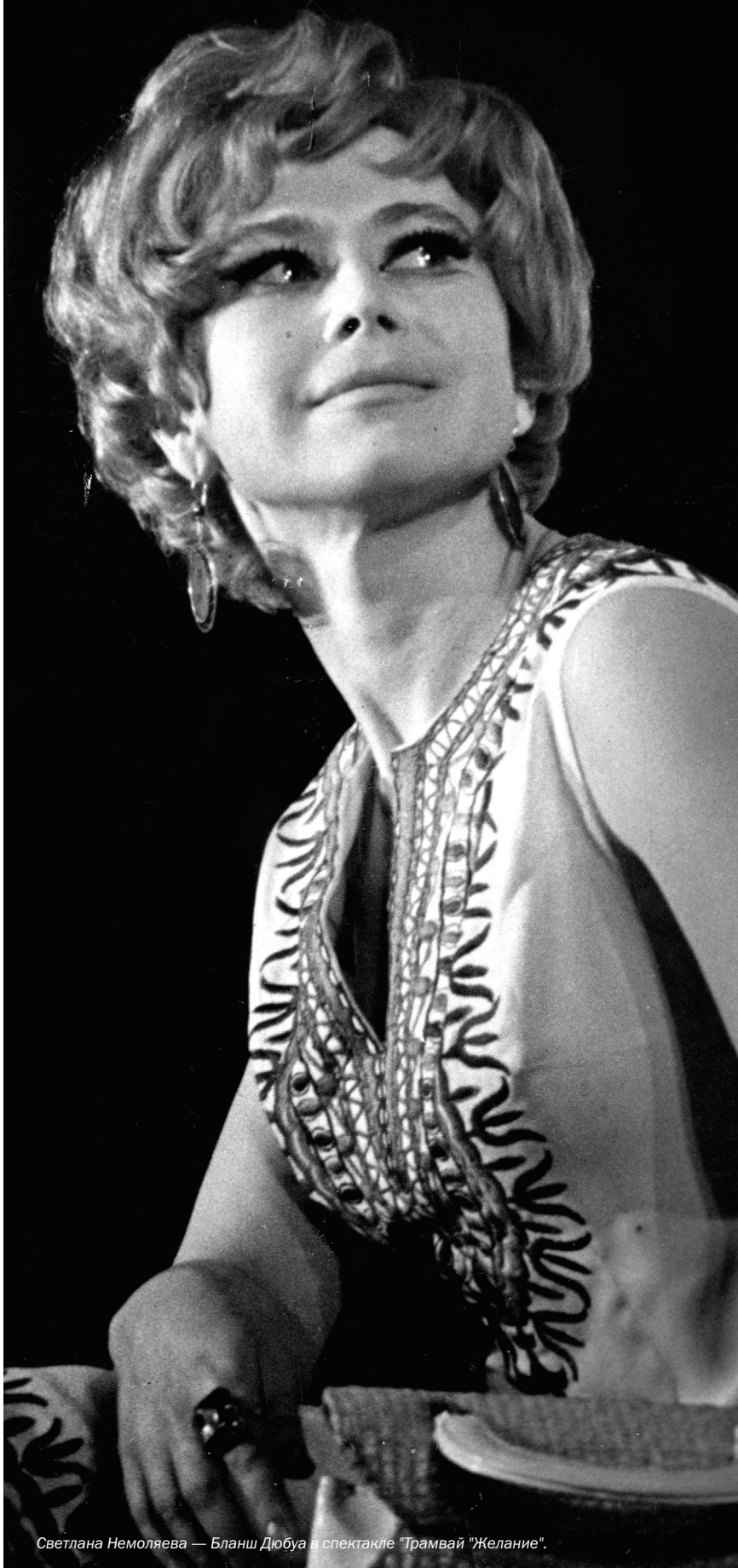
Светлана Немоляева — Бланш Дюбуа в спектакле "Трамвай "Желание".

Я не представляю ее без театра. Театр для нее — всё, и она доказывает это каждый день. — Игорь Костолевский